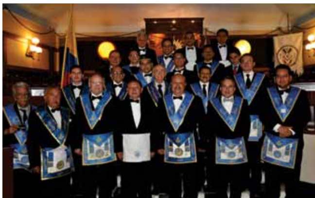
Iniciación en la Estrella del Tequendama.