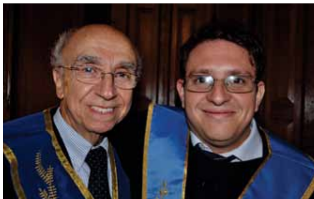
Visitante del Oriente de Barranquilla.