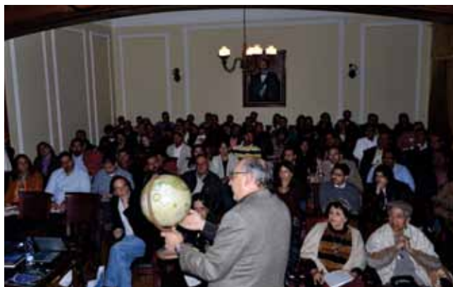
Indagando en el cosmos.