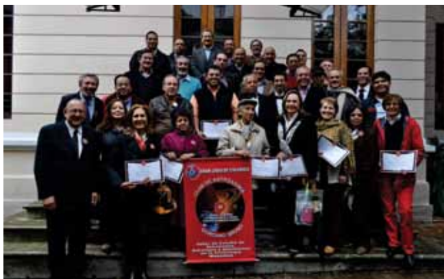
El Club de Astronomía