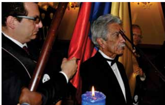
Exaltación del fotógrafo.