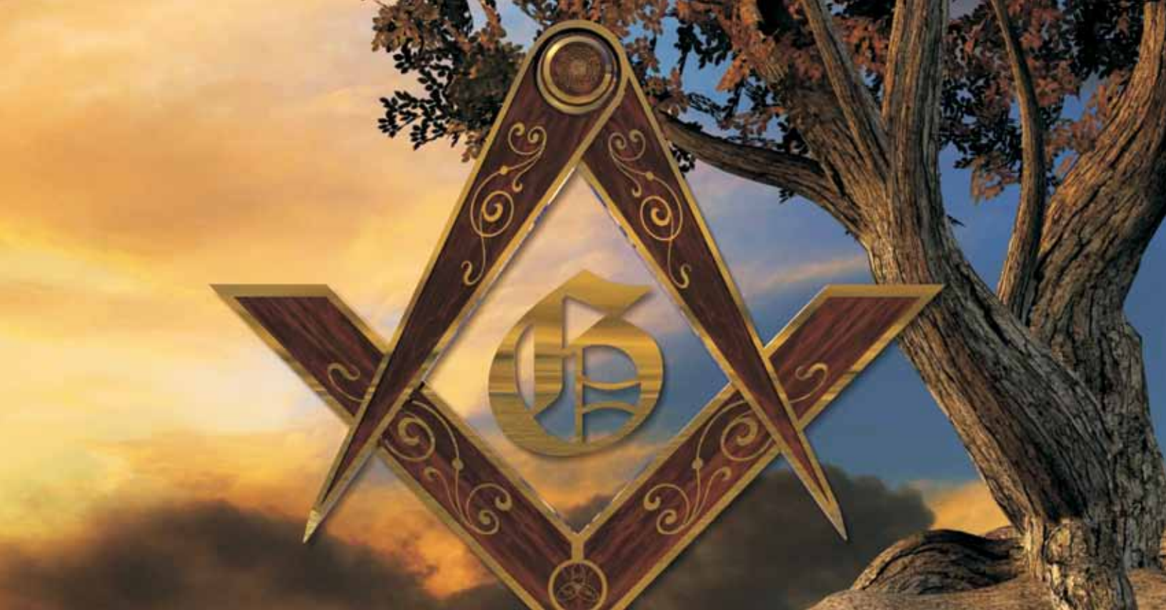
tabla de contenido