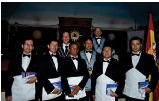
Proclamados en Forjadores de Igualdad.