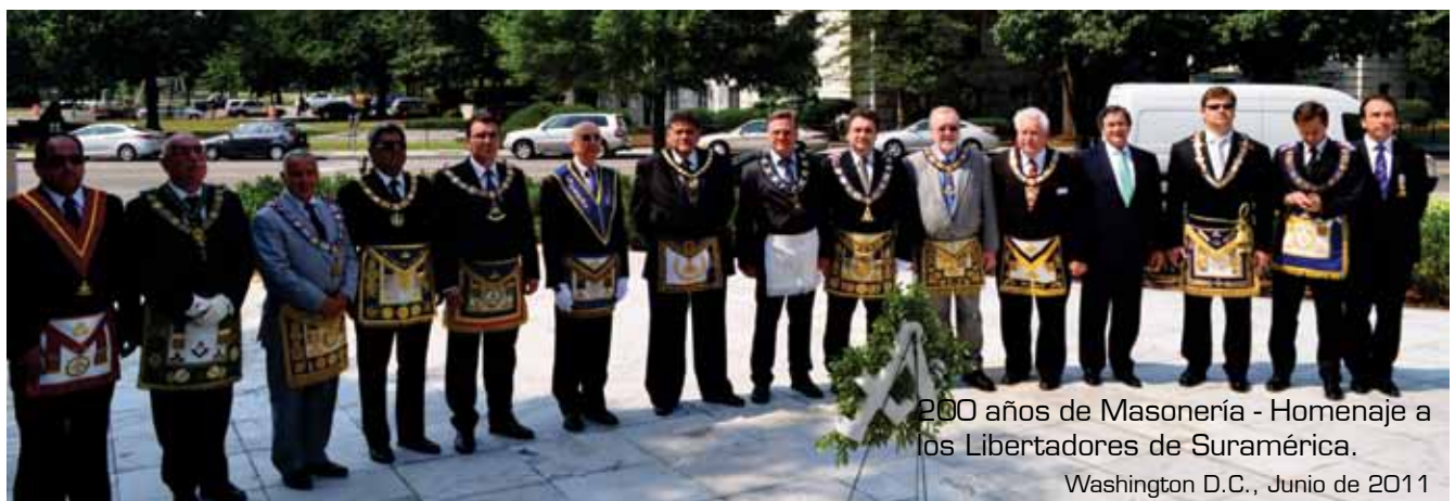
200 años de Masonería - Homenaje a los Libertadores de Suramérica. Washington D.C., Junio de 2011